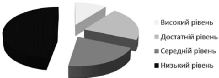
Рис.1 Рівні володіння лексичними одиницями учнями 2 класу до пробного навчання