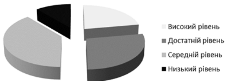
Рис. 2 Рівні володіння лексичними одиницями учнями 2 класу після пробного навчання

Перевіривши їх рівень володіння словниковим запасом до та після пробного навчання, ми побачили, що зменшили кількість учнів з низьким рівнем знань та значно зросла кількість із середнім та достатнім рівнем знань. Отож, це підтверджує нашу гіпотезу про те, що використання сучасних технологій та методик у викладанні мають позитивний вплив на ефективність засвоєння нових слів учнями початкової школи.